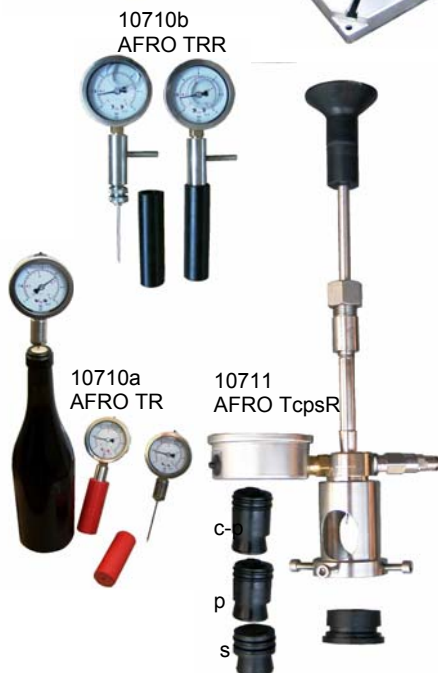
10710b AFRO TRR