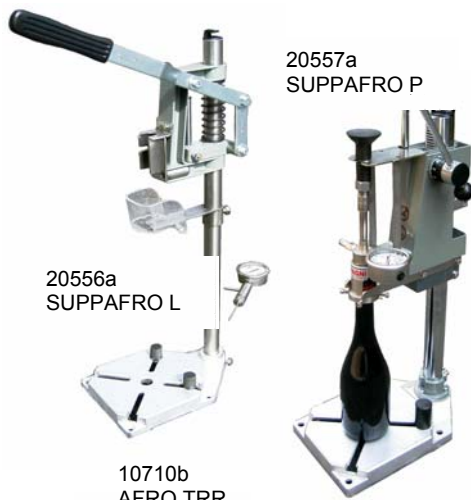
20557a SUPPAFRO P

A richiesta extra standard: Manovuotometri a glicerina cassa inox. per misurare: solo vuoto -1 solo pressione +6 +10 vuoto e pressione -1+3/-1+5 -1+9bar.