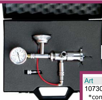
Confezione in valigetta