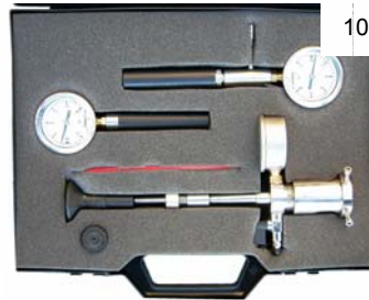
10713 AFRO UNI