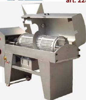
fig.3 o pompe monovite,fig.7

Disponibili altre soluzioni per soddisfare tutte le esigenze.