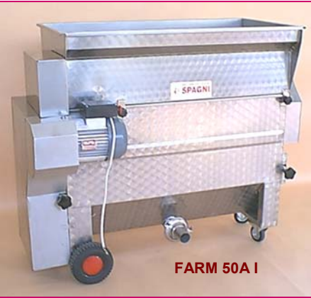
FARM 50A I

MATERIALI: macchina costruita solo in versione inox (I).