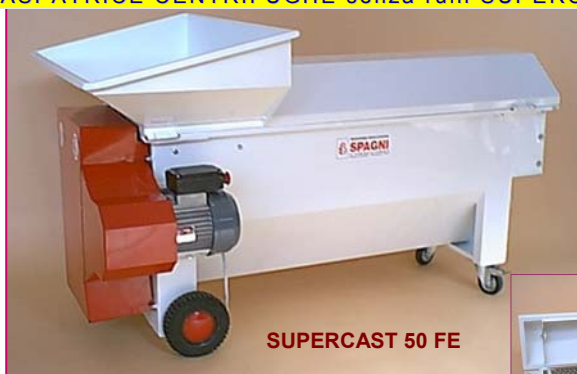
SUPERCAST 50 FE

La macchina è fornita di motore elettrico con arresto di emergenza, e di cassonetto antinfortunistico CE NORM (OBBLIGATORIO IN AMBITO CE) aumenta l'altezza della macchina di ca 50cm (non in foto)