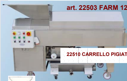
art. 22503 FARM 120

Macchina completa di protezioni antinfortunistiche, interruttore magnetotermico con pulsante di sicurezza. A richiesta inverter elettronico per variare in continuo la velocità dell'albero.