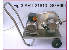
Fig.3 ART.21610 GGB60T

La pompa per trasferire il mosto alla pressa o al contenitore di fermentazione non è compresa nel codice di acquisto. A tal proposito noi proponiamo (fig.3 Art.21610) Elettropompa volumetrica girante neoprene a due velocità bisenso GB60T. Disponibili altre soluzioni per soddisfare tutte le esigenze.