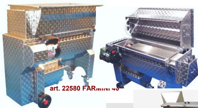
art. 22580 FARMINI 40

A richiesta: elettropompa con girante in gomma. Vedi pag. 39 e succ. VERSIONE SOLO tutto acciaio inox.