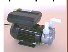
art.21957 TL20 pompa autoadescente Inox