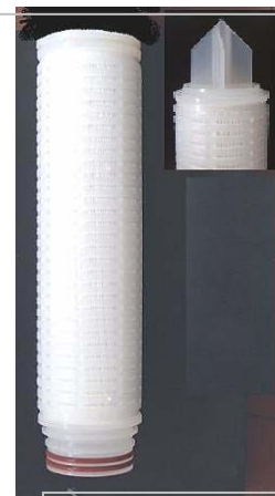
C7 P7 Cartuccia filtrante

TUTTE le cartucce: -a membrana di polieteresulfone assolute -polipropilene