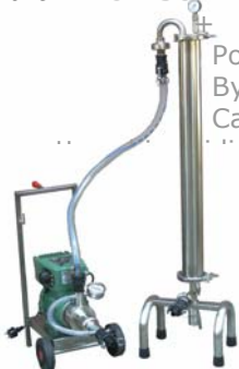
Pompa monovite By pass-inverter Carrello inox