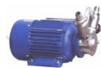
art. 22250+90404 GL6 pompa volumetrica inox Con by pass