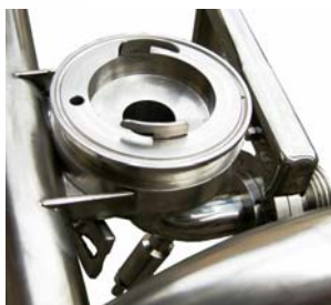
Vista attacco cartuccia unipezzo tornito