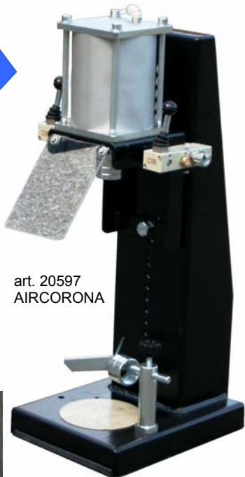
art. 20597 AIRCORONA