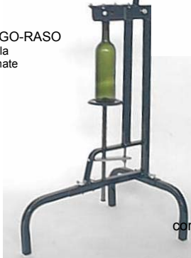
REGINA SC smontabile confezionato In scatola cartone