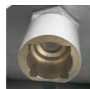
GPS Vista presa gabbietta

-Tappatore fungo elettromeccanico sollevamento bottiglia pneumatico -Gabbiettatrice sollevamento e tiro gabbietta sistema pneumatico (compressore escluso vedi foto1)