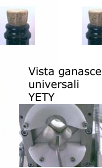
Vista ganasce universali YETY

Tappatore fungo elettropneumatico sollevamento bottiglia pneumatico (compressore escluso vedi foto1)