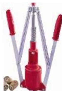
20418 EASY sughero