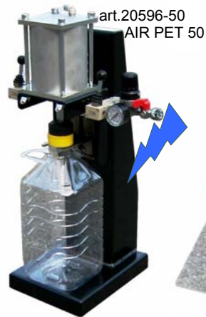
art.20596-50 AIR PET 50

TAAPPATORI CORONA ARIA TAPPATORI MANUALI PER TAPPUSUGHERO PLATICA CORONA Serie AIRCORONA EASY PLATINA