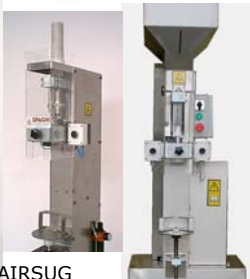
AIRSUG STANDARD Alimentatore a colonna