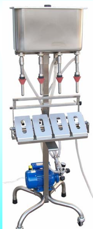
art. 10285-4 RP4 GL6 +opzioni

-NUOVA riempitrice semiautomatica per riempire tutti i liquidi anche alimentari compatibili con i materiali: acciaio inox Aisi 304 della macchina e della pompa, gomma alimentare per il girante a pale flessibili della pompa -BOTTIGLIE FORME: di serie tutte le bottiglie con foro tondo con diametro da 17 a 25 mm. diametri e altezze vedere Tabella Tecnica. Opzioni a richiesta: Erogatori speciali Coni tenuta speciali. -BOTTIGLIE MATERIALI di serie: VETRO ALLUMINIO PET fino a 1lt Opzioni a richiesta: appoggio basculante (vedi foto) per evitare deformazione nel riempimento di bottiglie PET e altri tipi di plastica leggera vedi dame quadre 3-5lt -RIEMPIMENTO delle bottiglie a livello costante a mezzo elettropompa volumetrica a 900rpm dotata di sensibile by pass meccanico che evita il 'rigonfiamento' delle bottiglie in PET leggero Opzioni a richiesta: Elettropompa fornita di regolatore elettronico di velocità per ottimizzare il riempimento delle bottiglie con la portata della pompa -SVUOTAMENTO con galleggiante meccanico a scarico automatico in pompa del liquido eccedente