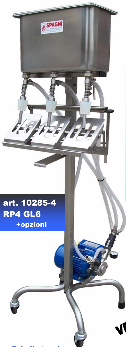
art. 10285-4 RP4 GL6 +opzioni

-NUOVA riempitrice semiautomatica per riempire tutti i liquidi anche alimentari compatibili con i materiali: acciaio inox Aisi 304 della macchina e della pompa, gomma alimentare per il girante a pale flessibili della pompa -BOTTIGLIE FORME: di serie tutte le bottiglie con foro tondo con diametro da 17 a 25 mm. diametri e altezze vedere Tabella Tecnica. Opzioni a richiesta: Erogatori speciali Coni tenuta speciali. -BOTTIGLIE MATERIALI di serie: VETRO ALLUMINIO PET fino a 1lt Opzioni a richiesta: appoggio basculante (vedi foto) per evitare deformazione nel riempimento di bottiglie PET e altri tipi di plastica leggera vedi dame quadre 3-5lt -RIEMPIMENTO delle bottiglie a livello costante a mezzo elettropompa volumetrica a 900rpm dotata di sensibile by pass meccanico che evita il 'rigonfiamento' delle bottiglie in PET leggero Opzioni a richiesta: Elettropompa fornita di regolatore elettronico di velocità per ottimizzare il riempimento delle bottiglie con la portata della pompa -SVUOTAMENTO con galleggiante meccanico a scarico automatico in pompa del liquido eccedente